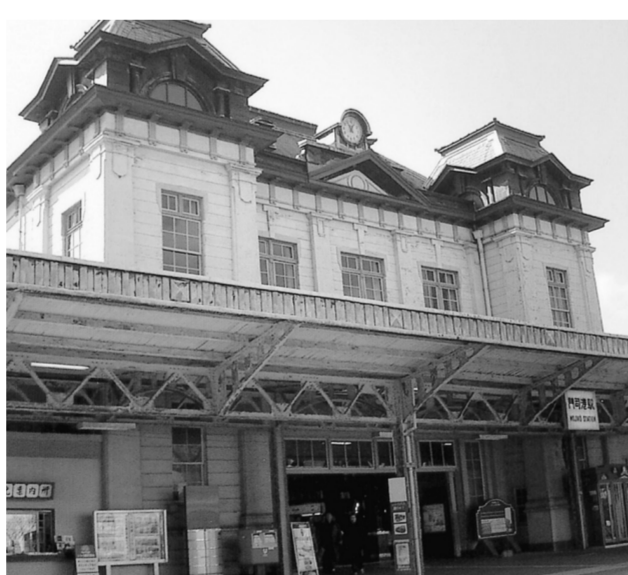
国重文の門司港駅

レトロ地区の整備事業は第1期300億円、第2期300億円という大きな事業費で進められている。北九州市が実施主体であり、行政主導のプロジェクトである。順調に進んでいるようだが、危機的状況が何度もあった。レトロ地区散策の拠点ともなるJR門司港駅は東京駅よりも早く国の重要文化財に指定された建物だが、昭和58年に解体の危機が訪れた。左右対称のネオレネッサンス様式の端正な木造建築。構内には関門連絡線の連絡通路跡もあり、門司の繁栄の記憶を伝える貴重な近代化遺産である。門司の住民たちは残すための住民運動を展開し、補修費3300万円のうち1200万円の寄付を集めて、保存を実現させた。旧門司三井倶楽部、大阪商船ビルも解体話が持ち上がった。昭和54年に策定された港湾整備計画がレトロ構想と同時に進行しており、かつて船舶を係留していた船だまりは全面埋め立てられることになっており、岸壁に建つ旧門司税関の赤煉瓦建物も取り壊される運命にあった。絶体絶命の状況から差ししのべられた救いの手は国のふるさとづくり特別対策事業の創設であった。昭和63年に同事業に採択された「門司港事業は動き出したのである。事業を進める企画課と港湾局との軋轢はしばらく続いたという。