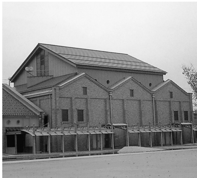
金沢市民芸術村の外観、広大な敷地の中に建つ

JR金沢駅から福井方面に向かい、犀川を渡る手前に広がる約9.7ヘクタールの広大な敷地に建つ旧大和紡績の煉瓦倉庫群を再生利用した「芸術と音楽、演劇」などの練習と発表のための施設。大正から昭和初期にかけて建設された規模や形状の異なる6棟の煉瓦倉庫を改修し、ピット1からピット5と名づけて工房化。「若者を中心に、演劇、音楽、美術、生活文化など多様な創作活動を通して、新しい文化の育成を目指す」場としている。各ピットは回廊で繋がれ、建物の前の広場はセーフティアリア(防災拠点広場)としての機能も持ち、2万6千食の備蓄、飲料となる井戸6基が備えられている。