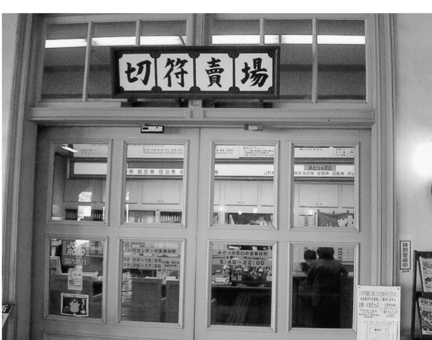
門司港駅の切符売場もレトロ調になっている

レトロ地区は埋め立てを免れた船だまりの周囲を回遊するように近代化遺産の建物が配置されているが、ギャラリーや喫茶店といった画一的な使い方が多い。また、課題にあげられている民間の人たちの姿があまり見られなかったことも気になるところだ。廃校になった小学校を開放した「門司港アート村」のアーティストのギャラリーが旧大阪商船ビルの二階にあるが、門司の人たちのものづくりや生活がレトロ地区に見えてくると、さらに精彩に富んでくるような気がする。