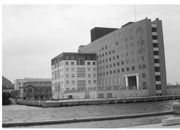
船だまり越しに見る門司港ホテル

北九州市門司港は九州の入り口という立地と港湾としての良好な地形、筑豊から産出される石炭の輸送量の増大などから明治22年(1889)に国の特別輸出港に指定され、日本を代表する貿易港として繁栄を極めた。明治24年(1891)には九州鉄道が開通し、九州における陸上、海上交通の拠点となった。これに伴い大手金融資本や商社が門司港に相次いで進出し、近代的なビルが建てられた。北九州の銀行14行中、9行が門司港に集中した。大正5年(1916)には横浜や神戸を凌ぎ、出入港船舶数が4974隻を数え、全国一の港湾都市となった。