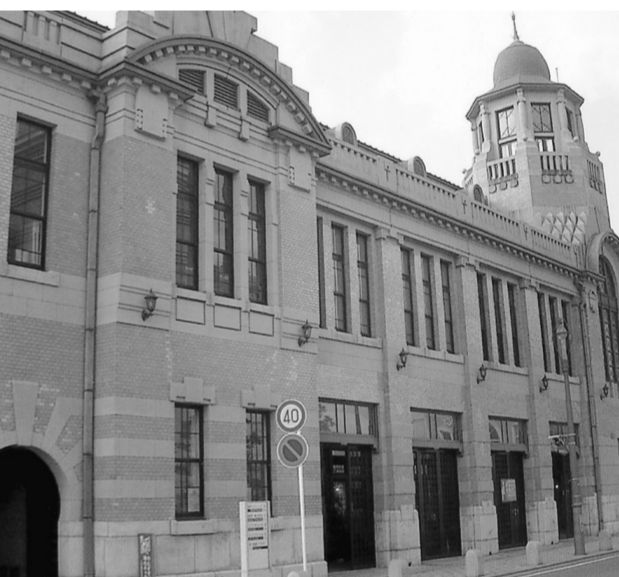
旧大阪商船ビル、内部はギャラリーになっている

第1期には、歴史的建造物の保存と活用として、旧門司三井倶楽部(国重要文化財)移転修理、JR門司港駅(国重要文化財)の補修、駅前広場の整備、旧大阪商船ビルの修復などが行われた。また、レトロプロムナードの整備や電線地中化、海峽めぐり回遊路、展望台の建設などの環境整備が行われた。