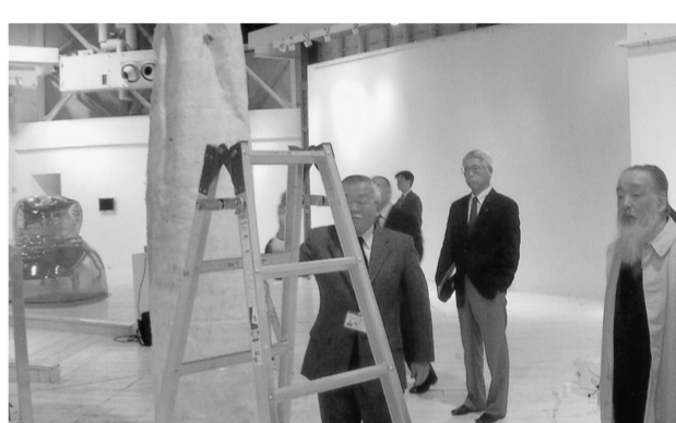
金沢市民芸術村の内部、各ピットは利用目的により様々な使い方が出来る