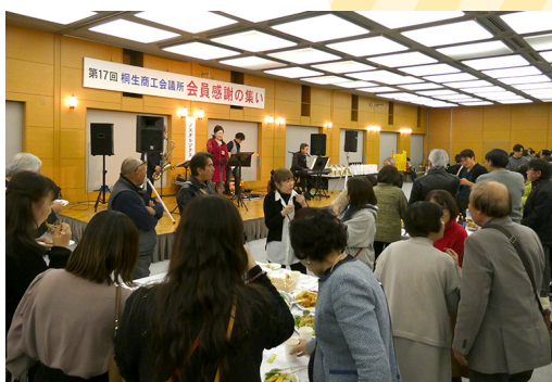
お馴染みの懐メロが会場を包み込んだ