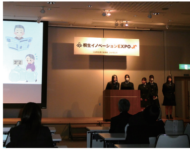
選ばれた2チームが学びの成果を発表した

生徒たちは9つのチームに分かれ、その集大成である最終発表において選出された2チームがEXPOに登壇。高齢者が抱えるコミュニケーション