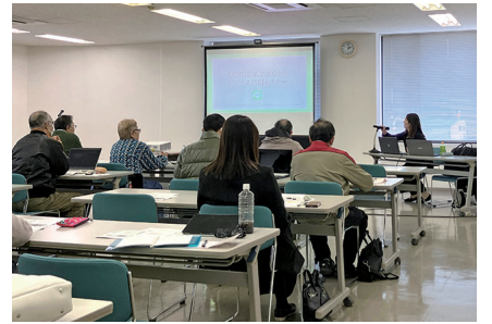
LINE公式アカウントの活用術が紹介された

最初にLINE公式アカウントの基本的な機能などを説明した後、配信にあたってのポイントや注意点を、実際の