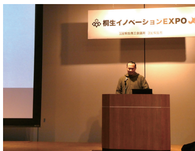
12名の塾生が練り上げたビジネスプランを披露した

きりゅう未来創造塾は、「地域の課題を自分事として捉え、自ら事業として解決策を描ける