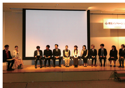
熱い議論が交わされたトークセッション