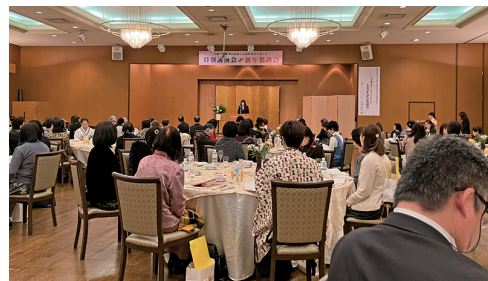
伊勢崎プリオで開催された県女連新年懇談会

るたを語る！」と題し、上毛かるたを通じて郷土の歴史を伝えてゆくこととの大切さについて講演された。引き続きの懇談会では、余興を交えて和やかに催され参加会員の交流を図った。