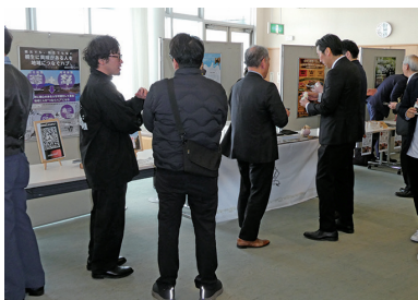
ポスターセッションで活発に情報が交わされた

きりゅう未来創造塾修了証授与式が行われ、所定のプログラムを修了した塾生12名に、塾長の荒木恵司桐生市長より修了証が授与された。その後「ポスターセッション」として、室外のロビーにて各ビジネスプランの概略を示したポスターを背に、登壇者が個別に名刺交換や質疑に、対応しつつ、それぞれの事業案を参加者相互や来場者に向けて積極的にPRした。