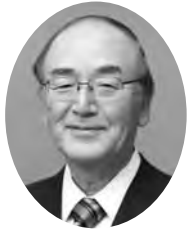
日本商工会議所 会 頭 三 村 明 夫

明けましておめでとございます。 平成28年の新春を迎え、謹んでお慶び申し上げます。