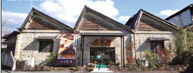
近代化産業遺産 (青柳本社)