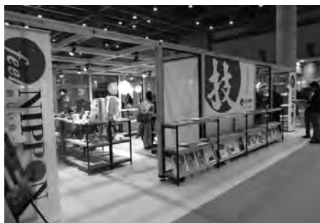
IFFT内の「技のヒット甲子園」ブース(東京ビックサイト)

アイデアを融合して次々に生まれる新商品から選りすぐりの良品を集め、地域発のヒット商店の発掘を目指すプロジェクト。今年9月には東京上野でエントリー商品を集めた展示・販売会を開催し、大手百貨店のバイヤーからも注目を集めた。