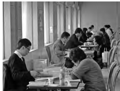
昨年の指導会のようす

所会館6階ケービックホール ▼対象者 桐生市内の青色申告者(個人) ※お問い合わせは、桐生商工会議所商業課(TEL 0277-45-1201)まで。