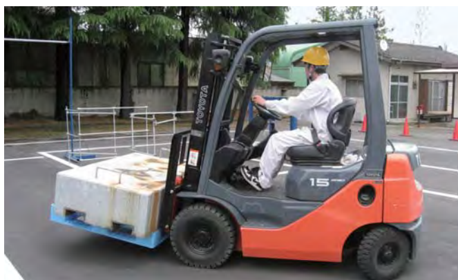
今年4月にスタートしたフォークリフト講習