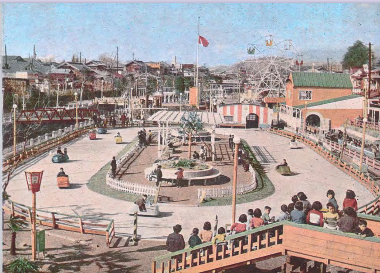
Shinkawa Children's Recreation Park in Kiryu City