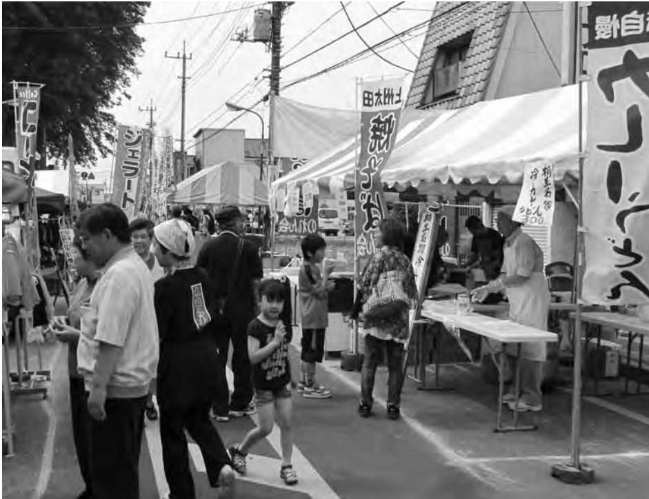
交流事業の一環として「麺の里」両毛五市の会が太田呑龍市に出店した（5月22日）

桐生商工会議所は今年度、両毛五市会頭協議会の幹事となり、五市商工会議所の交流事業に取り組んでいく。