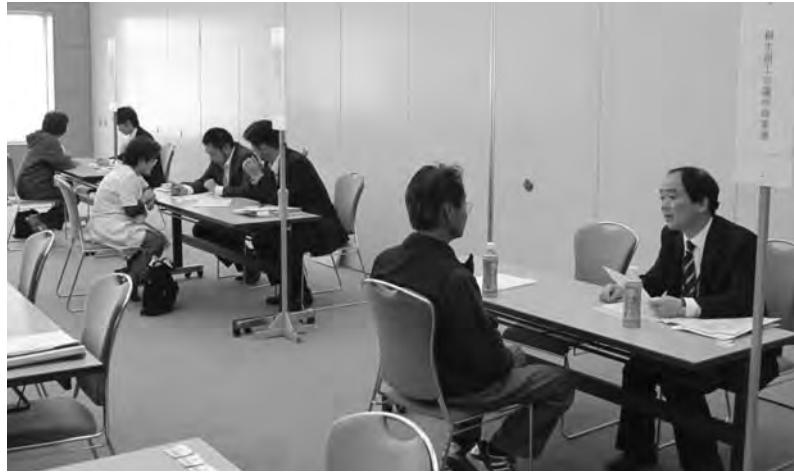
個別相談会も開かれた（5月16日・ケービックホール）

助成金や融資などの情報を速やかに分かりやすく提供し、震災で悪化した資金繰りに役立ててもらうことを目的に関係機関と協力して行われたもの。説明会では、桐生公共職業安定所が雇用調整助成金等の説明をしたほか、日本政策金融公庫は災害復旧貸付資金、群馬県は経営サポート資金、桐生市は市の制度融資、当所は小規模企業共済制度・倒産防止共済制度についてそれぞれ解説した。また、各機関の担当者がブースを設け、個