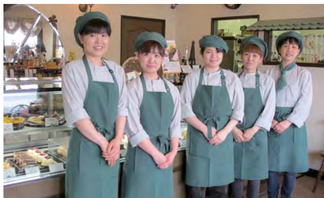
明るい女性スタッフが迎える