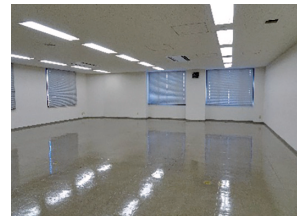
室内イメージ(305号室)