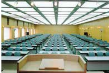
ケービックホール