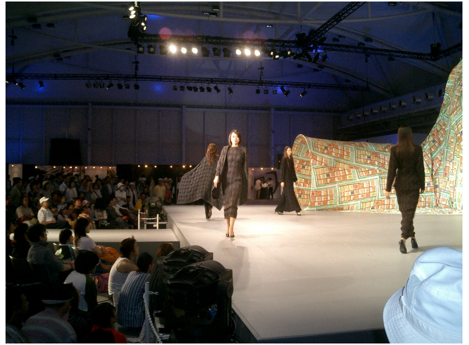
愛・地球博で発表された「テキスタイル in 桐生」大勢の観客が見守った（モリゾー・キッコロメッセ）