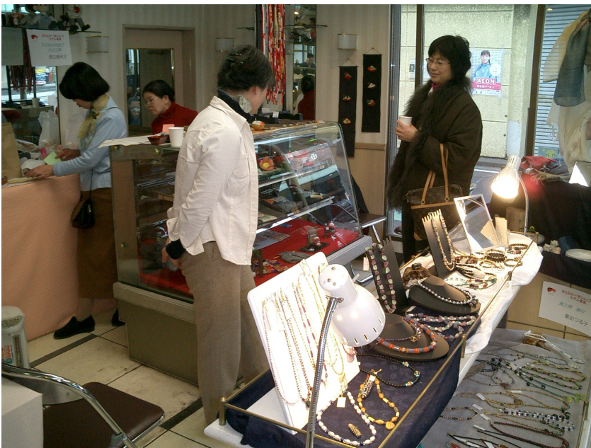
まちなか一坪ショップへのチャレンジ