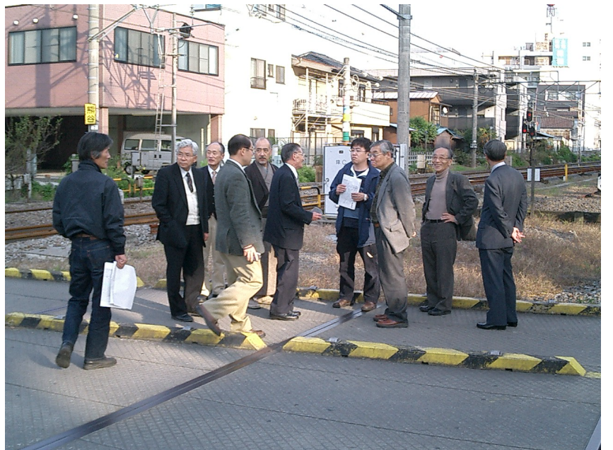
東武妻沼線の廃線敷を実地見学するメンバー（熊谷市）