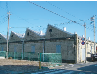
佐啓産業本町工場