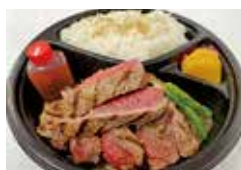
どっかんステーキ