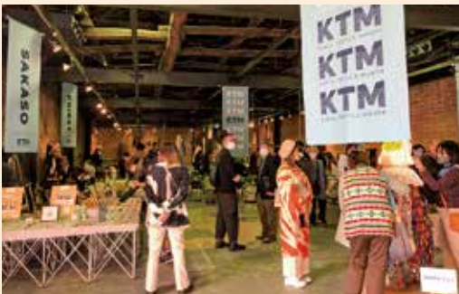
過去開催時(有鄰館会場のようす)

▽応募方法・期間 申込フォーム( https://forms.gle/NQL2BXBUrFWzwzwt6 )より、9月10日(日)までに申込み。