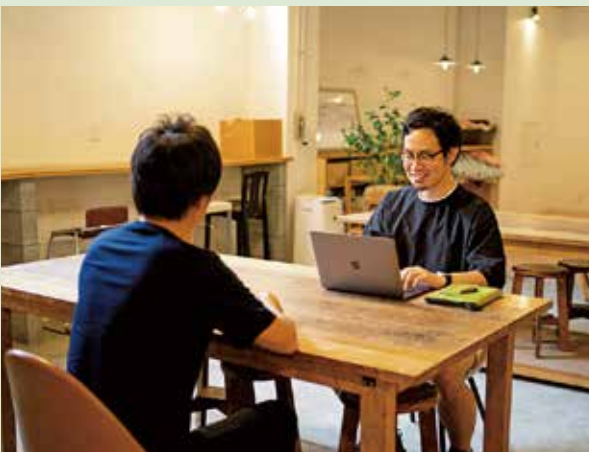
常駐するチーフコーディネーターが移住希望者の相談に応じる