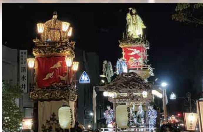
巨大な鉦が対峙する「鉦の曳き違い」

3日間の延べ来場者数は50万人。連日の猛暑とコロナ禍から尾を引く外出控えもあり、前回の通常開催時（令和元年、第56回＝56万5千人）との比較では減少となったが、賑わいの中心となる「八木節おどり」をはじめ各行事はいずれも大盛況。4年ぶりに戻った本格的な「桐生のまつり」の熱気を求める多くの人々で賑わった。