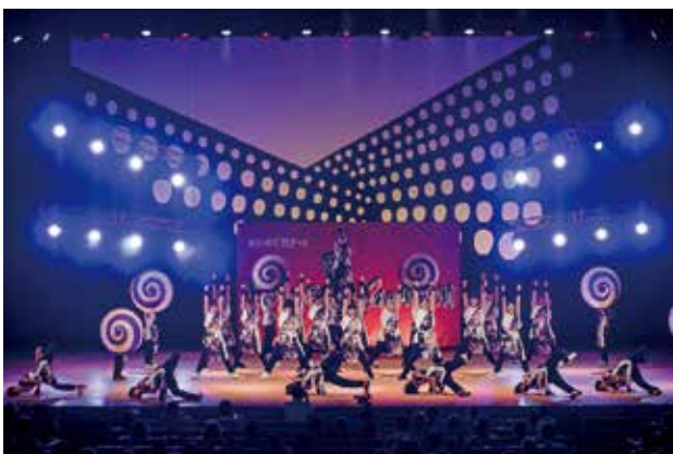
Team La Breaが連覇を遂げたダンス八木節