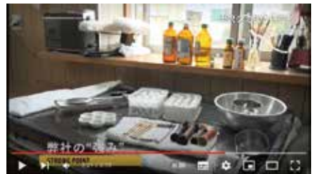
YouTubeで動画を公開している。

シミ抜きの世界は今でも徒弟制度の面があり、学校で教わるだけでは技術は身に付かない。「次の世代に知識と技術を伝承していきたい」と話してくれた。