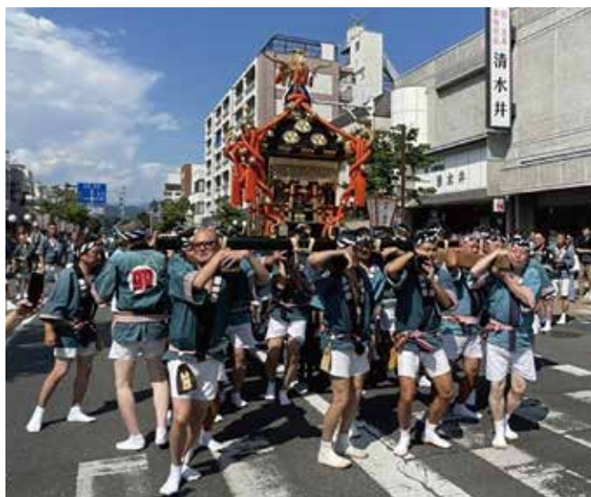
迫力ある掛け声が響く「みこし渡御」

桐生市最大の夏のイベント、第60回桐生八木節まつりが8月4日から6日までの3日間開催され、桐生市内本町通り、末広通りのまつりメイン会場を中心に来場者が埋め尽くし、桐生のまちなかを熱気が包んだ。