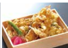
穴子入豪快海鮮天重