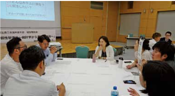
グループワークのようす

とされる。 参加者は、同分類ごとのグループワークで行動の傾向について共感し合い、その後の懇親会ではツールとして交流を深め有意義な時間を過ごした。