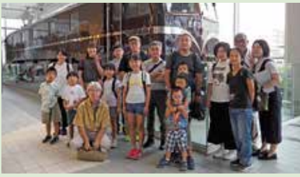
研修会の参加者(鉄道博物館にて)

おり、日本の鉄道についての理解を深めた。参加者は充実した1日を通して、夏休みの楽しい思い出を作っていた。