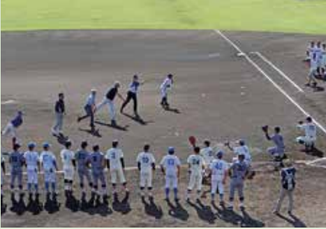
選手たちが見守るなか行われた「ファーストピッチ」

9月6日には今春のWBC2023で世界を制した日本代表監督の栗山英樹氏を招いたシンポジウムを開催し、「球都桐生」を盛り立てる。