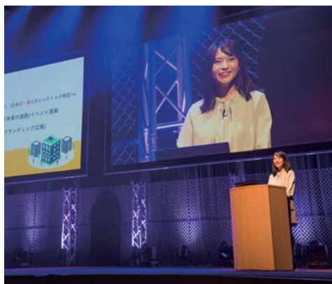
桐生イノベーションEXPOのようす（令和3年）

また、DX（デジタルトランスフォーメーション）やカーボンニュートラルなど、SDGsを念頭に新時代に即した各種支援にも積極的に対応する。