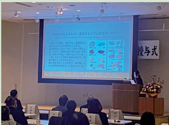
堂々と自身の意見を述べる塾生

発表後には修了証の授与式が行われ、共同実施者の荒木恵司桐生市長から、塾生に修了証が手渡された。