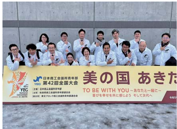
青年部全国大会に参加した当所青年部のメンバー