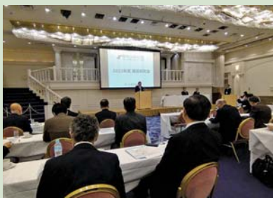
成田市で開催された関商連運営研究会

カーボンニュートラルの取り組みについては、会員への支援、職場での取り組みともに何から手を付けてよいか迷っているような状況、日商のCO2チェックシートの活用や省エネ診断、補助金などの施策情報の提供などが必要との意見が多かった。