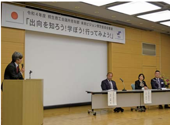
交流を促進する「出向」について理解を深めた

第2部終了後には情報交換会が同会場にて開催され、名刺交換をはじめビジネスに繋がる交流が活発に行われた。