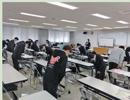
社会人のマナーを学んだ新入社員研修

研修は午前・午後の二部構成で、午前中は「電話応対・接遇セミナー」、午後には「ビジネスマインド研修」が行われ、職場におけるコミュニケーションの基礎や大切さを学んだ。参加者は緊張した面持ちで熱心に受講していた。