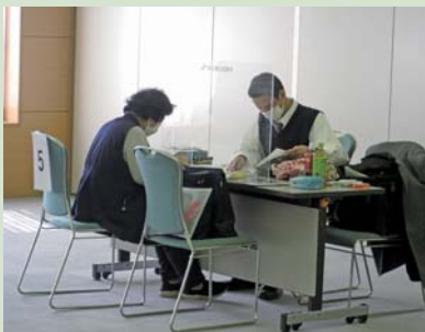
申告書の作成指導会のようす

この指導会は確定申告の時期に合わせて、桐生市内で事業を営む青色申告者を対象に毎年開催しているもの。昨年に続き今回も新型コロナウイルスの感染防止の点から、密を避けるために事前予約制で相談者を募った。 会期中は予約した約50人が来場し、税理士や会議所職員が相談に対応した。