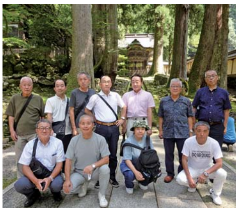
視察研修に参加した建設部会のメンバー（永平寺）

最終日は金沢市内を視察。金沢建築館や金沢21世紀美術館などを訪問し、北陸を巡る視察研修を締めくくった。