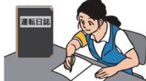
運転日誌の備付け