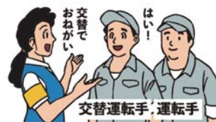
交替運転者の配置