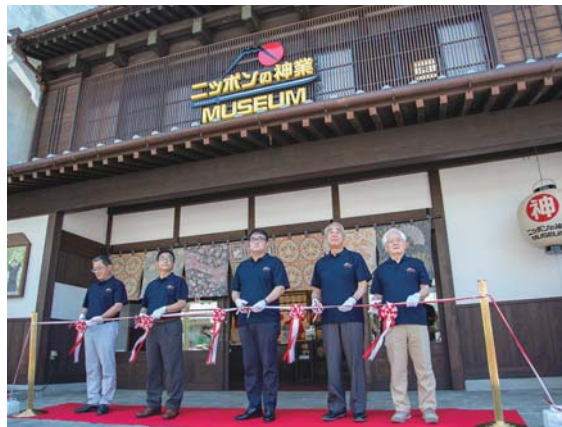
6月25日のオープニングセレモニー