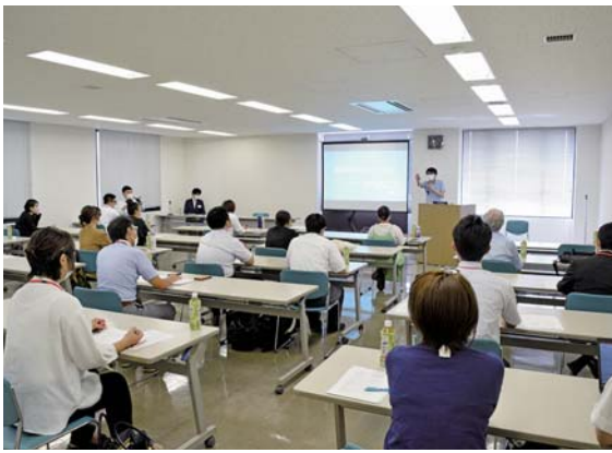
イノベーションアカデミーのスクーリング

今年度募集したのは桐生地域で創業を目指す人や、新事業を作り上げていく仲間を探している人などで、