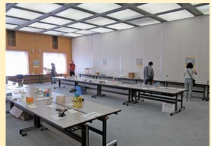
全作品が展示された展覧会のようす