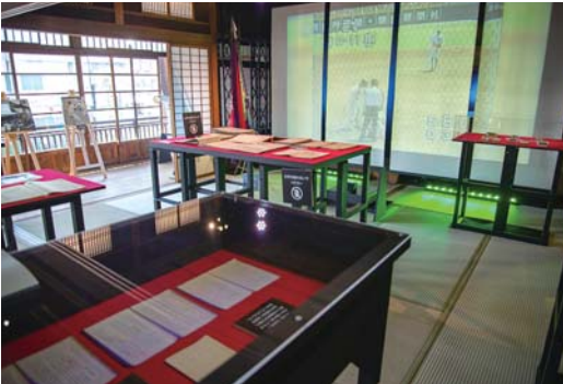
球都を代表する名将・稲川東一郎を紹介

し、大きな話題を集めた。11日には、八王子出身で江戸時代に桐生の町立てを担った大野八右衛門ゆかりの大太刀「御蛇丸」の特別展示も行われ、桐生と八王子の歴史ロマンに迫った。その他にも、ミュージシャンによるライブイベントや繊維に関連するものづくりイベントなどで、ミュージアムを盛り上げている。