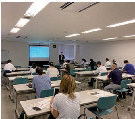
Googleを活用した集客に多くの関心が集まった

コロナ禍で、ネット活用がますます重要になる昨今、参加者は自社の経営に少しでも活かそうと熱心に聴講していた。