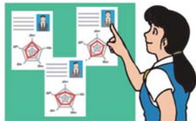
運転者の適性等の把握