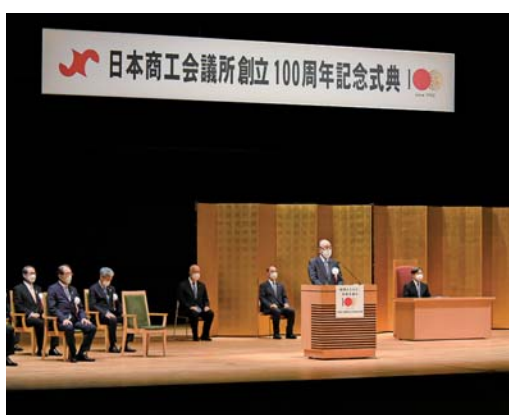
式典で式辞を述べる三村明夫日本商工会議所会頭

▼日本商工会議所100周年記念特設サイト www.jcic.or.jp/anniversary