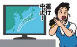
異常気象時等の措置