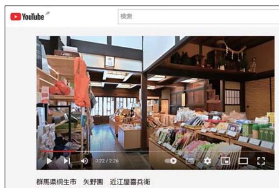
群馬県桐生市 矢野園 近江屋喜兵衛

矢野園については、歴史ある店舗、商品の魅力を十分に伝えられる動画を制作できました。また、近江屋喜兵衛については、趣のあるお座敷、料理の高級感などを伝える動画に仕上がりました。外部の視点を取り入れることで、今まで気づかなかったような撮影角度、新しい魅力の伝え方が非常に参考になりました。コロナが収束した後は、重伝建地区の観光拠点として、遠方からのお客様にもご満足いただけるよう、受け入れ態勢を整えて参ります。