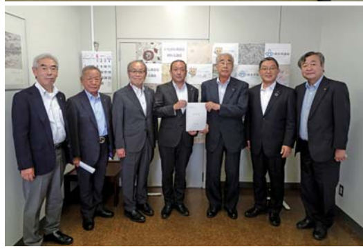
荒木恵司桐生市長と北川久人議長に政策提言要望書を提出

また、群馬銀行の統合や新規出店などによる交通渋滞も問題となっており、まちなかの駐車場整備にも協力を求めた。