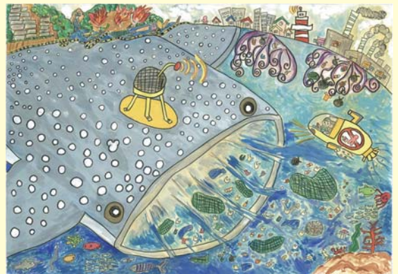
桐生市長賞の「巨大ジンベイ海洋おそうじロボット」