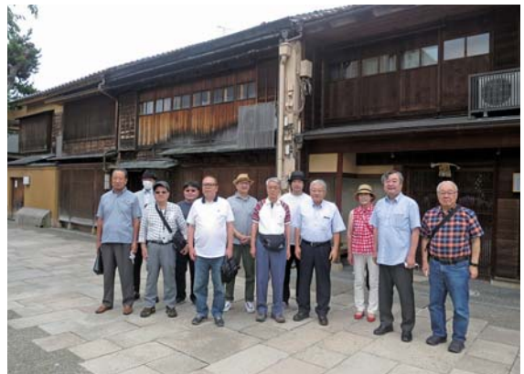
視察に参加した商業部会の議員・幹事（金沢市）