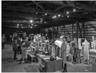
全国から来場者呼び込んだクラフトキャラバン

その他、有鄰館では11月1日(木)から4日(日)に「一日一作家(一工場)特別展覧会」11月3日(土・祝)にはなつかしの昭和のおやつ「子供洋食&ぎゅうてん販売会」など、FT桐生推進協議会主催による恒例の人気イベントがFWを盛り上げた。 また、今回初めて本町一丁目にあるノコギリ屋根工場・旧曾我織物工場が会場として開放され、10月27日(土)・28日(日)に桐生西ライオンズ