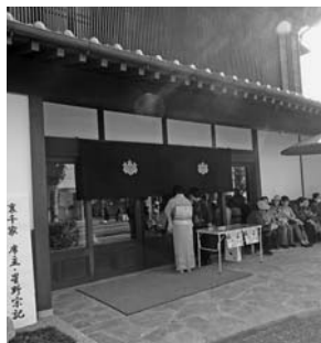
にぎわいを見せたギャラリー-禅林

最終日11月4日(日)には、旧車の祭典「クラシックカーフェスティバルin桐生」(実行委員会主催)が、群馬大学理工学部桐生キャンパスで開催され、約300台の希少車両を一目見ようと市内外から2万2000人が訪れた。 今回は日産自動車の協力のもと、天皇陛下が皇太子時代に愛用した「プリンスセダン」を特別展示し、平成最後のフェスティバルに華を添えた。 閉会后、恒例の本町通りのパレードでは、沿道に詰めかけた観衆が小旗を手に参加車両を温かく見送った。