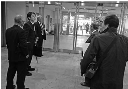
会館から地下通路でつながる「アウガ」

全国を先導した中心市街地活性化の光と影を象徴する青森市の状況を県連の専務理事らは熱心に視察していた。