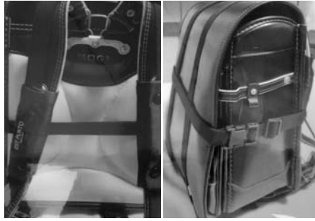
入選の「ランドセル用重量軽減背筋矯正ベルト「KINJIRO Z」

第89回群馬県創意くふう作品展が、10月28日、11月3日、4日の3日間、群馬産業技術センターで開催された。この