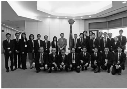
愛知県商工会議所連合会の視察団と当所経営指導員

同研究会は、中小企業相談所事業等の業務改善・効率化を図るために、県下商工会議所経営指導員を中心に視察団を組織しての調査研究を毎年実施している。 本年度は、桐生商工会議所が平成27年7月に経済産業省の認定を受け、現在5年計画で管内小規模事業者の持続的発展のための伴走型支援・ワンストップ支援に取り組んでいる「経営発達支援事業」について、視察研修の申し入れがあった。