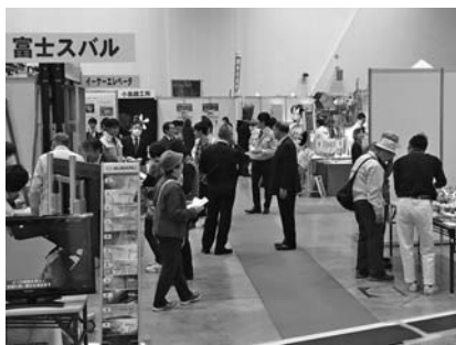
たかさき産業祭2018のようす

当所が策定した「経営発達支援事業」については、11月に新潟県の下越8商工会議所経営指導員研究会と、福島県内商工会議所経営指導員研究会からも講師派遣要請があり、職員が新発田市と郡山市に向いてそれぞれ講義を行っている。