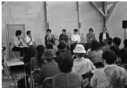
多彩なゲストによるトークセッション(旧曾我織物工場)

その他、有鄰館では11月1日(木)から4日(日)に「一日一作家(一工場)特別展覧会」11月3日(土・祝)にはなつかしの昭和のおやつ「子供洋食&ぎゅうてん販売会」など、FT桐生推進協議会主催による恒例の人気イベントがFWを盛り上げた。 また、今回初めて本町一丁目にあるノコギリ屋根工場・旧曾我織物工場が会場として開放され、10月27日(土)・28日(日)に桐生西ライオンズ