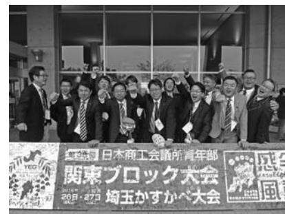
関東ブロック大会に参加した青年部メンバー

な性質を持っているか、小字の名前に残された先人のメッセージを読み解くことで解ることがあると述べられ、参加者一同、講師の作成した地図等の資料を参考にしながら興味深く聴講していた。