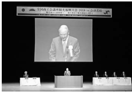
全体会議で挨拶する日本商工会議所・三村明夫会頭

2日目には「広域連携」、「歴史資源」、「災害と観光」など5分野のテーマに分かれた分科会や、仏教文化や会津五街道を巡るエクスカージョンなども開催され、会津の魅力に参加者にアピールした。次回大会は石川県金沢市で開催される。