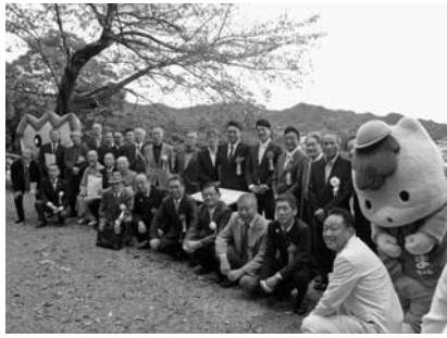
除幕式に参列した来賓ならびに関係者

たもので、華山が水道山公園から本町一・二丁目を眼下に収めた「桐生新町図」といともものしずかなる中に、水車と機音とうちまじりて、わがこころ甚たのしむ」などの一文を焼き付けた陶板がはめ込まれている。