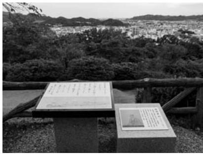
桐生新町を臨む記念碑

除幕式には、大澤正明群馬県知事（代理・栗原桐生みどり振興局長）、亀山豊文桐生市長をはじめ、地元県議会議員や市議会議員、記念碑製作に協力した関係者ら約30名が出席。桐生の新しいモニュメント誕生を盛大に祝った。記念碑の設置にあわせ、11月13日まで桐生歴史文化資料館（本町二）にて華山の作品展も開催されている。