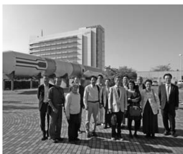
筑波宇宙センターにて（つくば市）