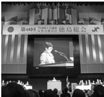
全女連徳島総会のようす

島総会を開催した。全国の324女性会から会員2358名が出席した総会では、第15回女性起業家大賞授賞式が行われ、最優秀賞の