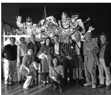
環境・生活部会議員らが参加した視察研修

絵さんによるライブ演奏も披露される中、出席者同士の交流を深め青年部35年の節目を盛大に祝った。