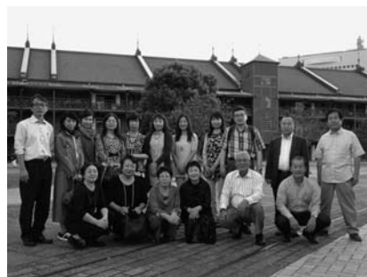
視察研修に参加したFTメンバー（横浜市）

横須賀市は呉市、佐世保市、舞鶴市と共に旧軍港都市として、平成28年4月に文化庁の日本遺産に認定。以来、その構成文化財を活用した観光ツアーなど積極的にプロモーション事業を展開している。