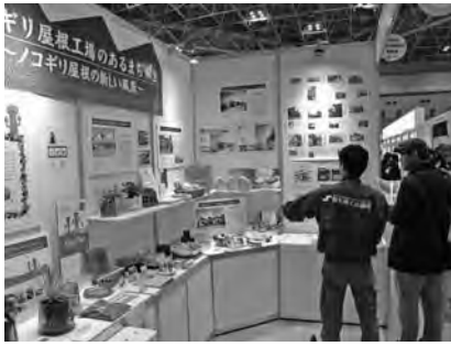
昨年のフィールニッポンのようす

「ノコギリ屋根工場のあるまち桐生」ノコギリ屋根から始まる地域創生」をテーマに、ノコギリ屋根工場が持つ特徴ある景観とその可能性、そこから生み出される地域固有の繊維製品などを紹介する。当所では平成二十年十二月にノコギリ屋根博覧会を開催して以来、同二十三年からはフィールニッポンに連続して出展し、桐生市のノコギリ屋根工場から生み出される数々