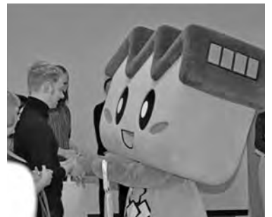
キノピーが海外バイヤーをおもてなし

セッションが開始されると、バイヤーはブースを隈なく訪問し、出展者の製品説明を熱心に聞いていた。ブランドのコンセプトや独自のセンスで製品を見定め、興味を引く製品はサンプルを依頼している場面も見られた。セッション終了後、マックスマラーのイタリア人バイヤーに話をうかがうと、「桐生は一つの産地として成熟している」とセッションの印象を述べた。また、自国のシルク産業の集積地であるコモと比較し「桐生は小さなコモ」と、高く評価し、製品についても「各製品、非常に高いクオリティで、自社の採用基準を十分に満たすものばかりだった」と述べ、桐生の高い技術力に満足している様子だった。貴重な商談会を通じて、各企業の海外ブランドへの提案と共に「産地・桐生」をPRすることができた。