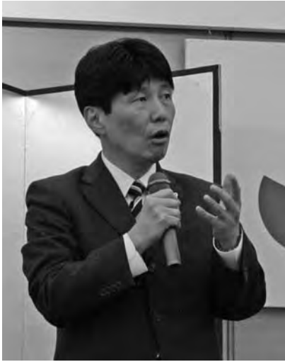
山本一太 参議院議員