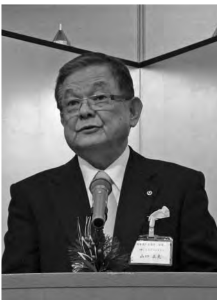
主催者あいさつを述 べる山口会頭（左）