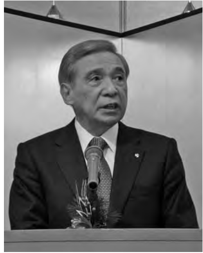
大澤正明 群馬県知事