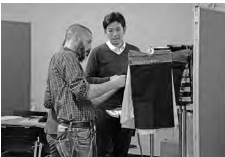
桐生の繊維製品に高い関心を示すバイヤー

昨年からジェトロが主催する商談会に参加する形式を取っている。四年目となる今回は、TPS出展企業のうち十三社が参加し、「桐生セッション」として単独に割り当てられた時間内で欧米六ブランドのバイヤーに直接提案した。今回は「マックスマラー」(イタリア)、「イザベル・マラン」(サンローラン)、「ランバン」(以上フランス)、「アレキサンダーマッククイー」(イギリス)、「ビルブラス」(アメリカ)と、いずれも欧米のトップブランド六社が参加。セッションの開会式では「産地・桐生」をPRするため、桐生市のマスコットキャラクター「キノピー」から記念品が手渡されると、各バイヤーは日本独自のキャラクター文化に興味を示していた。