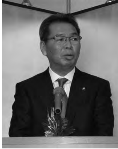
亀山豊文 桐生市長