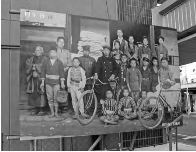
明治～昭和初期の様子を現代に甦らせるビルボード

この事業は商店街のにぎわい創出を目的とした取り組みへの助成事業で、当所は本町錦町、末広町の各商店街振興組合の協力の下、老舗店舗や桐生ならではの歴史ある街並みを活かした複数のプロジェクトから構成されるにぎわい創出事業を実施している。メインのプロジェクトとし