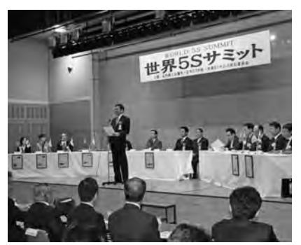
Sのまち足利」を世界に向けて発信する。二〇一二年に行われた第一回世界5Sサミットには、世界十二ヶ国から二百八十名が参加した。

十一月六日(木)、七日(金)には、足利商工会議所・足利5S学校・世界5Sサミット実行委員会共催により第二回世界5Sサミットを開催、「5