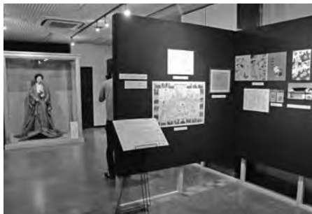
館内には関連する歴史・文化資料も多数展示

展示は十二月二十四日まで。展示時間 午前10時～午後4時 休館日 毎週月曜日(祝日開館 翌日火曜休業) 入場料 無料