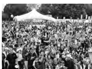
今回の招待出店として、うどん天下一決定戦二〇一四で「売上部門」と「評価部門」の両部門で一位を獲得した、花山うどの「鬼ひも川」や、せたが屋ラーメン、沖繩そばなど有名どころが出店する。

館林商工会議所では、第四回「麺ー1グランプリ」館林」を十一月一日(土)・二日(日)、館林市役所東広場で開催する。うどん、そば、やきそば、ラーメン、パスタの麺自慢五〇店が集結し、来場者の投票でグランプリを決定する。