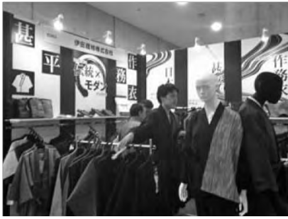
ギフトショーに出展した伊田繊維㈱のブース

桐生からは二十二社が出展し、「桐生の伝統繊維産業とアニメコンテンツとの融合プロジェクト」のメンバー七名が、先進地で取り組みや市場の最新ニーズ調査の為、会場を視察した。同プロジェクト