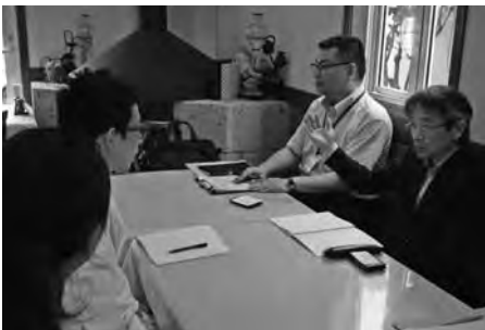
経営課題に専門家が無料で対応