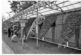
盆養・小菊の懸が、約五百本の菊花が集結する。期間は「菊苗等の販売」