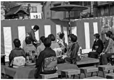
〔着道楽inきりゅう〕各所に茶席が設けられる

タウン広場のステージでパフォーマンスコンテストも開催。二十五日(土)には「かぼちゃのランタン作り」も行います(午後一時～)。