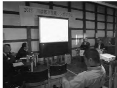
川越で開催された伝統的建造物群街会議

川越会議は、全国十四都市のケーブルテレビ局や商工会議所関係者が出席しての総会が川越商工会議所で開催され、続いて「かわごえ都市景観表彰式」と合流。参加都市の事