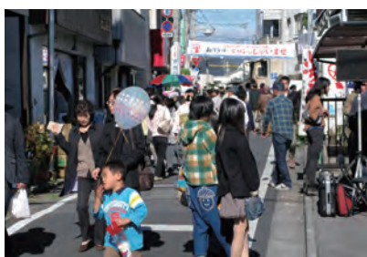
糸や通りいらっしやいませ