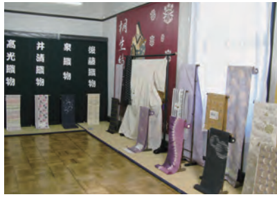
きりはた御披露目