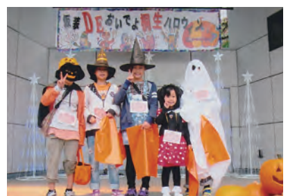
仮装 DE おいでよ桐生ハロウィン