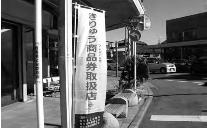
登録店には「のぼり旗」が立てられ活気を見せている

登録店の店先には、商品券が利用できる目印となる「のぼり旗」が立てられたり、ポスターが貼られるなど、商店街などが賑わいと活気を見せている。 商品券は一枚千円の券を十一枚綴りにしたものを一セットとし、十一枚の内訳は一般商店専用券が六枚、大型