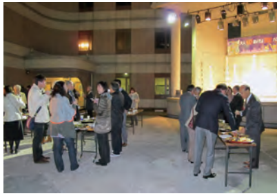
オープニング&交流パーティー