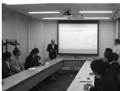
リコユニテクノ(株)本社工場を視察

なお、桐生ビジネス倶楽部は随時参加メンバーを募集している。次回企画は、十二月十二日（水）開催の知的資産セミナー。お申込・お問い合わせは、桐生商工会議所工業課（TEL〇二七七―四五一二〇）まで。