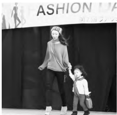
商店街の11店舗が参加したショッピングコレクションショー

なつかしの昭和のおやつ「子供洋食&ぎゅうてん」が、十一月三日(土)に有鄰館煉瓦蔵前の広場で販売された。