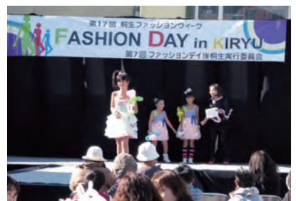
ファッションデイ IN 桐生