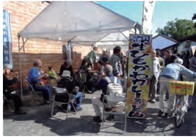
桐生うどん会「ひもかわカレーうどん」