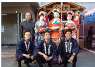
着道楽インきりゅう