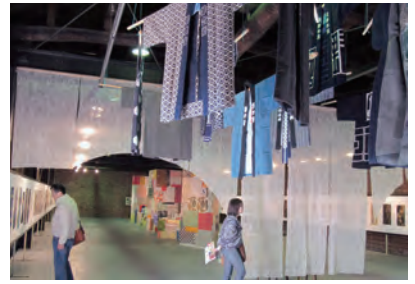
まちとデザイン (有隣館芸術祭)