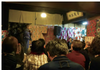
桐生織塾『モデルになった銘仙』展