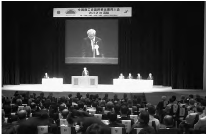
高知市で開かれた全国商工会議所観光振興大会

野朗氏との対談「観光のこれから」田舎とその産業をどう見せるか」が行われ、高知の歴史、風土、文化などを検証、「高知の課題は全国共通の課題。現在、観光は多様なテーマで人が集まってくる。テーマをきちんと作れば訪れる人が必ずいるということ、地域の受け皿作りが重要。個人旅行者向けにも天候等でプランが中止になった時にはセカンドプランを出せるようにしたい。これができるかどうかが大切」と受け入れ体制の重要さが指摘された。