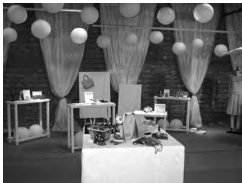
今回新設された“桐生カワイイ”のブース

広沢町を走行したラリーは多くの見物人が沿道に出て手を振ったほか、会場では、「子どもお絵描きコンテスト」も人気を集め、お気に入りの車を見つけると、真剣な表情でクレヨンを動かしていた。同フェスティバル恒例となった本町通りのパレードでは、今年も沿道の観衆が手旗を振って車両を見送ると参加者は名残惜しそうに帰路に就いた。