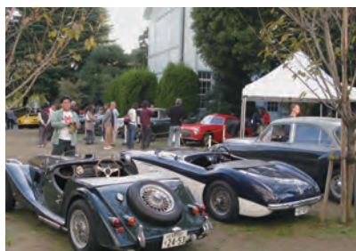
第7回クラシックカーフェスティバル in 桐生