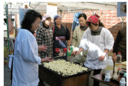
昭和が香る。「子供洋食・ぎゅうてん」