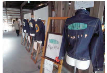
桐生刺繍商工業協同組合展示