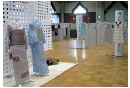
桐生テキスタイルプロモーションショー