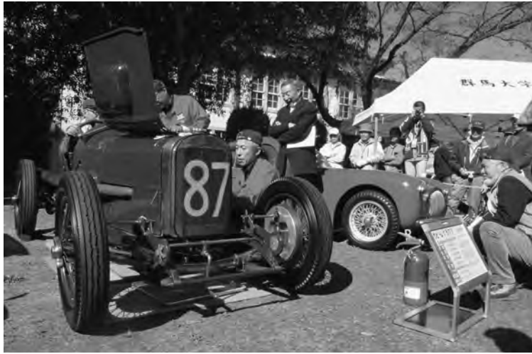
エンジンがかけられたトヨタ博物館の「サンビームグランプリ」

当日は、初めての試みとして三吉町の臨時駐車場から会場までをボンネットバスが巡回した。バスは日産ディーゼルの「U690」型で一九