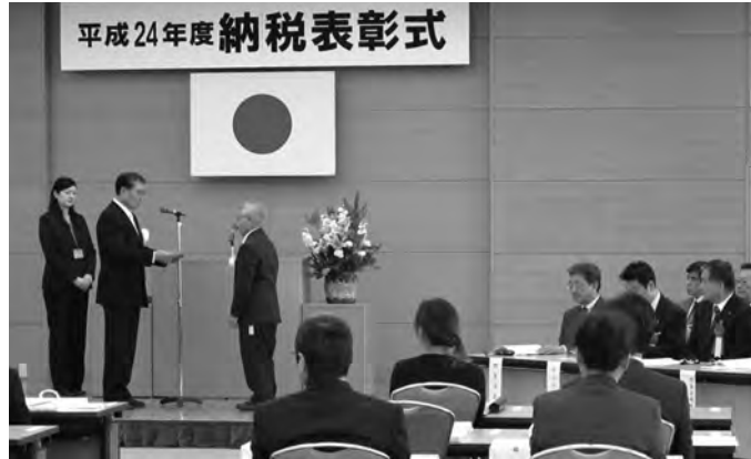
当所ケービックホールで開催された納税表彰式