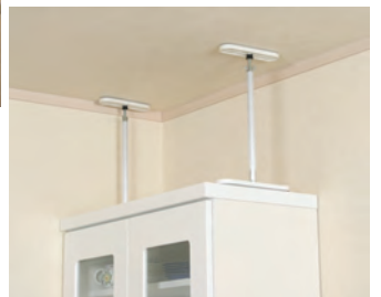
地震対策用品「ふんばりくん」