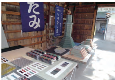
桐生畳工事協同組合展示