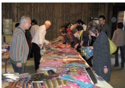
素敵なあなたに～ニット応援隊～