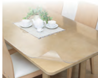
家具をキズや汚れから守る「PSマット」