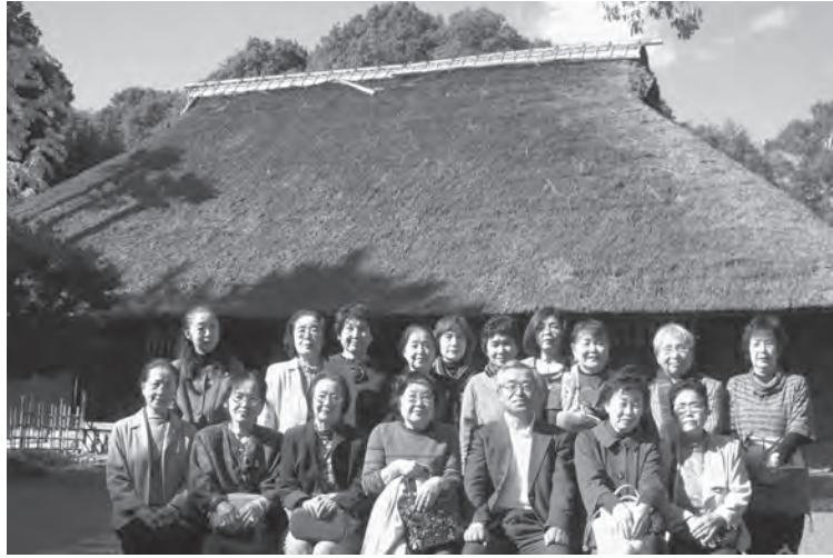
郷土の文化財「彦部家住宅」を訪れた女性会メンバー（11月8日）

城跡ガイダンス施設」「縁切寺満徳寺資料館」等見学し、次世代に引き継ぐべく大切な郷土の文化財の理解を深めた。