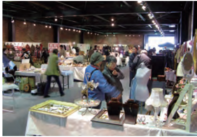
一店一作家(一工場)特別展覧市