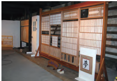
桐生建具木工組合展示