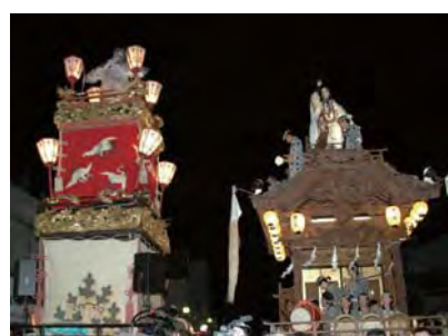
銚の曳き違い (祇園)