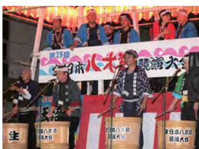
全日本八木節競演大会 (決戦)