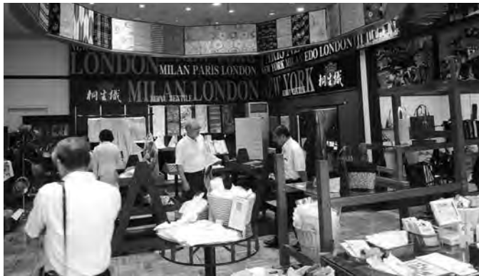
(上) オープンを記念して関係者によるテープカットが行われた (下) 伝統を守りつつ斬新さも加わった和装売り場