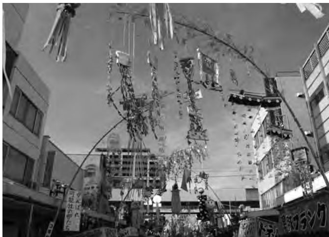
真夏の空を彩る「七夕かざり」。八木節まつりに欠かせない夏の風物詩となっている。(全日)