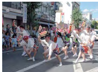
ジャンボパレード (朱雀連)