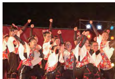
ダンス八木節 (サークルスマップ)