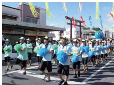
ジャンボパレード (ミツバグループ)