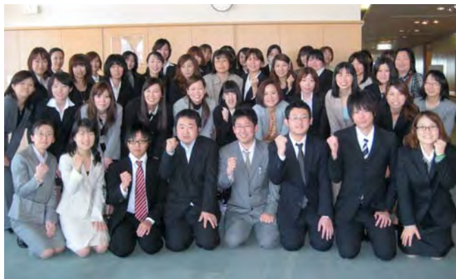
いつも笑顔を決やさないスタッフ一同

ココロとココロのつながりを大切にしている訪問看護、デザイナービズのCOCO10。看護師、作業療法士、理学療法士、言語聴覚士による専門的なりハビリがマンツーマ