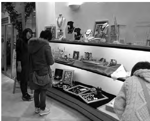
前回のまちなか展覧市のようす(モギカバン本店)

今回展示販売する店舗は、せと糸商店、桐生さくらや、モギカバン本店、菊屋、コバトラ薬局、シロキヤ書店、小野眼鏡店、マルキン本店、クイーン堂シューズ、かわち商店、山梶商店、近江屋書店、奈良屋銅鉄本店、大澤呉服店、フジエ小間物店、宝石時計・清水一心堂、ZONA