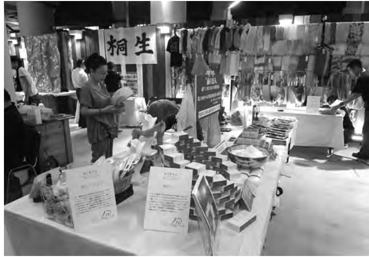
(上) イベント会場となった「2K540 AKI-OKA ARTISAN」 (下) 桐生市内17企業の商品が販売された