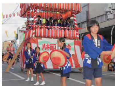
八木節子ども大会