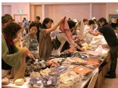
桐生織物メチャクチャ市