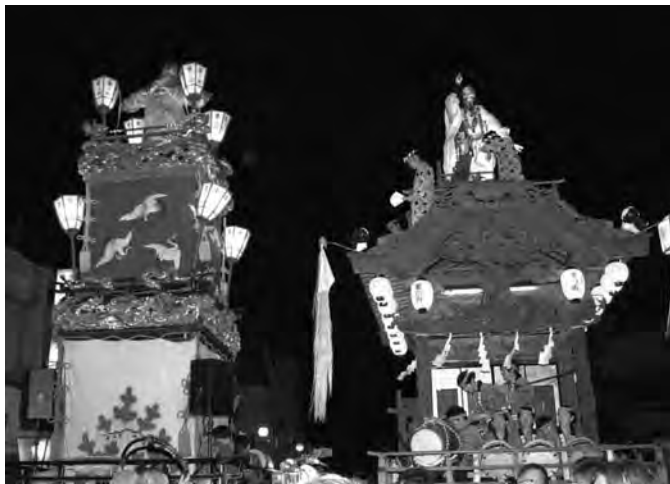
今年も中に行われた「鉦の曳き違い」。その荘厳で迫力ある姿が沿道の観客を魅了した。(8月4日)

今回も、多くの事業所・個人の皆様から協賛金のご協力をいただきました。心より感謝申し上げます。なお、ご協力をいただいた皆様のお名前は、桐生八木節まつりのホームページ(kiryu-maturi.net)に掲載させていただいております。