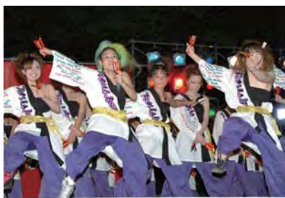
ダンス八木節 (Team La Brea)