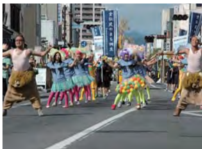
ジャンボパレード (桐生市役所)