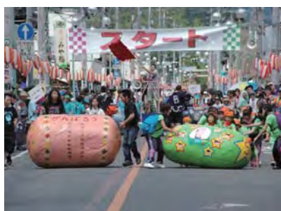
まゆ五ころがし大会