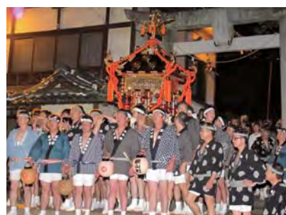
みこし宵の出御 (祇園)