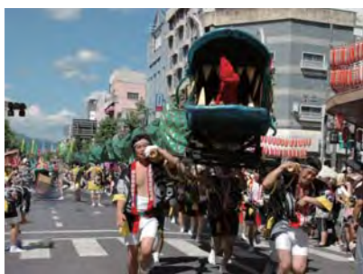
ジャンボパレード (桐生織物協同組合)