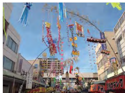
本町六丁目七夕かざりコンテスト