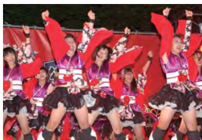
ダンス八木節 (美翔女隊+J)