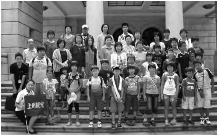
研修会に参加したクラブ員と家族 (8月10日)

桐生少女発明クラブの東京都への視察研修会が、八月十日(金)に実施された。同クラブは、桐生地区内の児童・生徒を対象として創意工夫に基づく創作活動の場を提供し、アイデアを具象化する能力と技術を持った創意的な豊かな人間を形成することを目的に活動しており、本年度で二十七年目を迎える。視察研修会には、クラブ員、家族、指導員ほか計三十九名が参加した。はじめに上野の「国立科学博物館」を見学し、科学の歩みや自然の成り立ちを体験・学習した。続いて、今年五月に開業した「東京スカイツリータウン・東京ソラマチ」を見学し、児童・家族一緒になって東京の新名所を満喫した。参加した家族は「夏休みの良い思い出になりました。」と話していた。