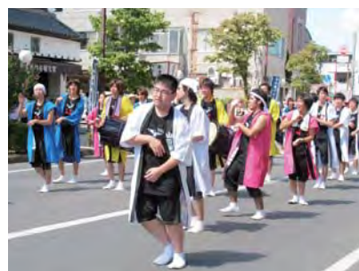
ジャンボパレード (鞍山山製作所)