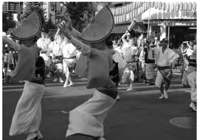
二年振りの参加となった「朱雀連阿波踊り」。華麗な踊りに多くの観客が酔いしれた。(8月4日・5日)