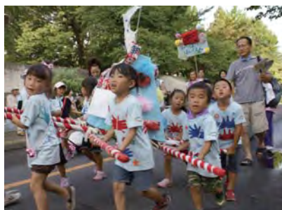
子どもみこしパレード