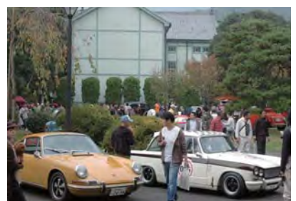
クラシックカーフェスティバル in 桐生