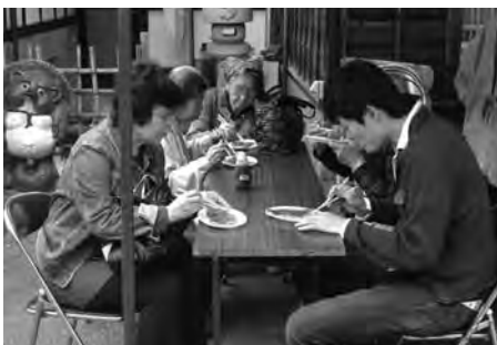
なつかしい昭和の味は今年も大人気

FT生活文化委員会食文化創造プロジェクトが行うグルメの掘り起こし企画で昨年に続いての開催。販売が開始されると、昭和の時代を思い出させる懐かしい匂いに誘われて多くの人が集まった。