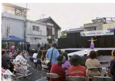
FASHION DAY in KIRYU