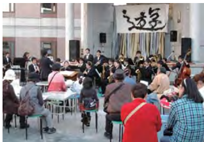
音・食・遊・買メイトバススペシャル