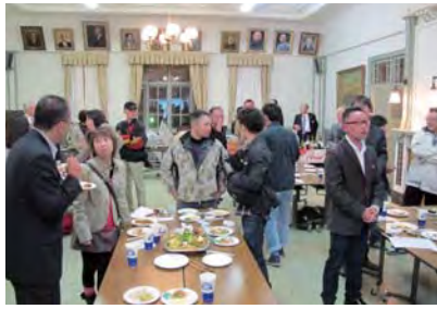
オープニング&交流パーティー