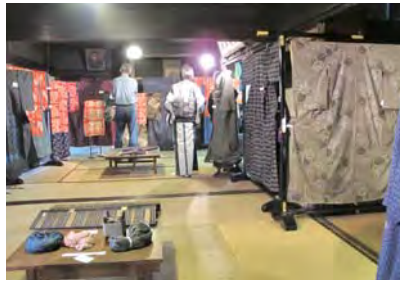
桐生織塾企画展『締』