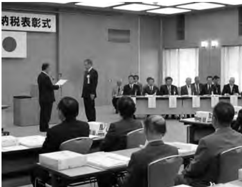
当所ケービックホールで開催された納税表彰式