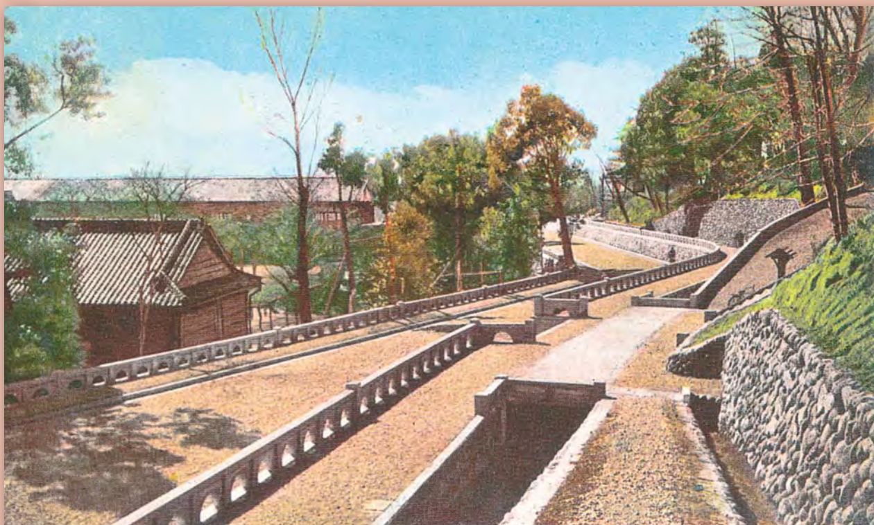
(桐生市) 山手線の一部