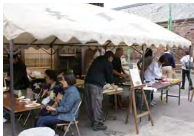
「子供洋食とぎゅうてん」販売会