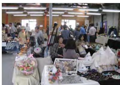
一店一家(一工場)特別展覧市