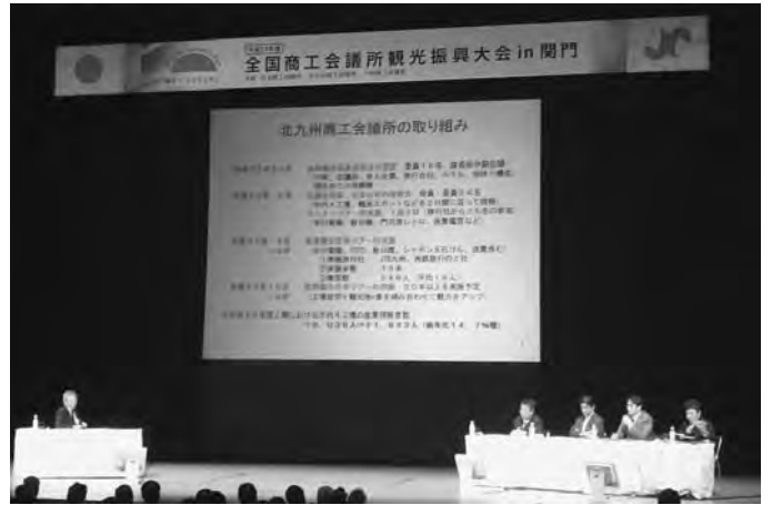
北九州市で開かれた全国観光振興大会