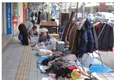
本六「ふれあいフリーマーケット」