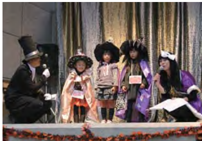
仮装 DE おいでよ桐生ハロウィン