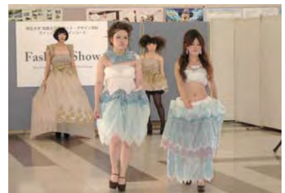
桐生大学「駅なかファッションショー」