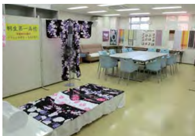
桐工・桐一「作品展示」