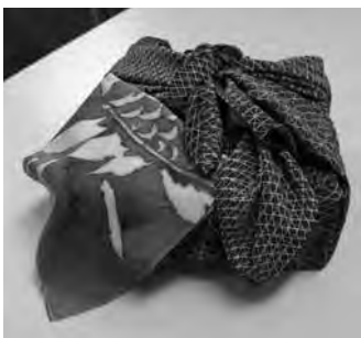
超撥水風呂敷「ながれ」

今年度のグッドデザイン賞は三千六百六十二件の中から千二百二十二件（六百四十九社）が選ばれた。中小企業長官賞は朝倉染布を含む八社が受賞した。