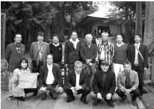
日産の電気自動車「リーフ」のシステムを学んだ商業部会（上） 平泉中尊寺などを視察した建設部会（下）

考えると今後重要な位置を占めると思う」と述べ、ガソリン車やハイブリット車と比べた特色について説明。