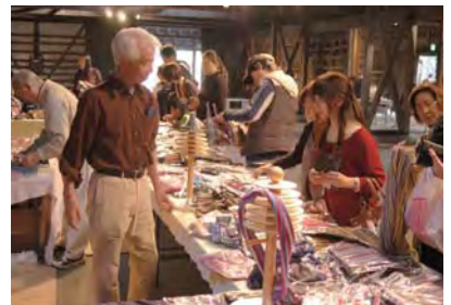
素敵あなたに～ニット応援隊～