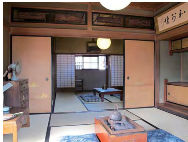
公開されている矢野家当主の居室

「矢野本店店舗及び店蔵」は平成14年（2002）11月に、古民家再生技術によって、改装され、矢野園、米蔵・お休み処、喫茶有鄰として営業を行っている。矢野蔵群として桐生市に寄贈した「有鄰館」と一体となり、本町一、二丁目のシンボルとして、買い物や建物の見学、写真撮影やスケッチする人など多くの人たちが訪れている。