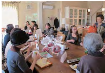
東北支援「カリゼ・カフェ」