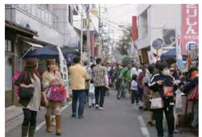
糸や通りいらっしやいませ