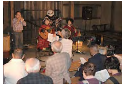
彦部家住宅「中南米軽音楽」