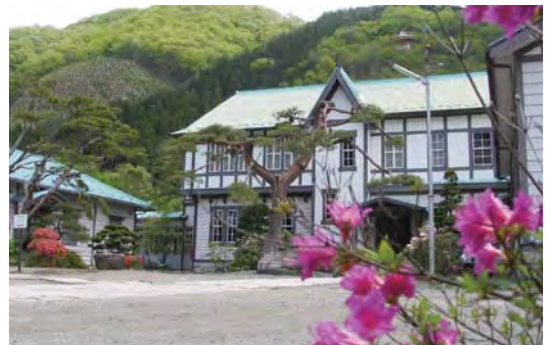
■ 古河掛水倶楽部 ☎0288-93-3255 (平日) ☎0288-93-2015 (土日祝)