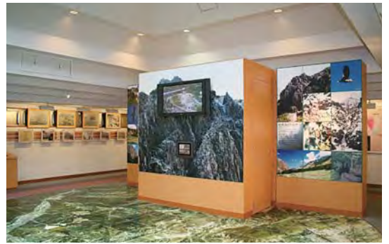
■ 足尾環境学習センター ☎0288-93-2525