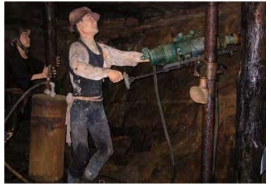
■ 足尾銅山観光 ☎0288-93-3240

自然を楽しむなら、“日本のグランドキャニオン”と呼ばれる松木渓谷や庚申川沿いに位置する豊かな自然に囲まれた银山平キャンプ場、近くには足尾温泉「庚申の湯」があり、疲れた体を癒してくれます。