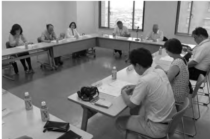
第1回専門委員会（7月20日）