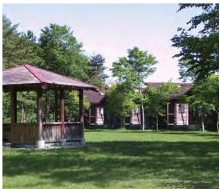
■ 银山平キャンプ場 ☎0288-93-0511