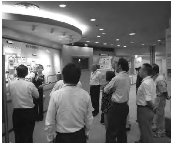
ガイドの案内を熱心に聞く参加者たち (刈羽原発)

の発電所で作られた電気は、東京電力管内で使われている電気の約二十%を占め、供給エリアへ送電されている。原子力発電はウランが核分裂するとき発生する熱によって水を蒸気に変え、七十気圧二百八十℃の蒸気がタービンを一分間に千五百回転させ、発電機で電気を作るしくみ。ウランはリサイクル可能使い終わった蒸気は復水器で毎秒九十二七の海水によって冷やされ、再び繰り返される。冷却に使用されることでの海水上昇