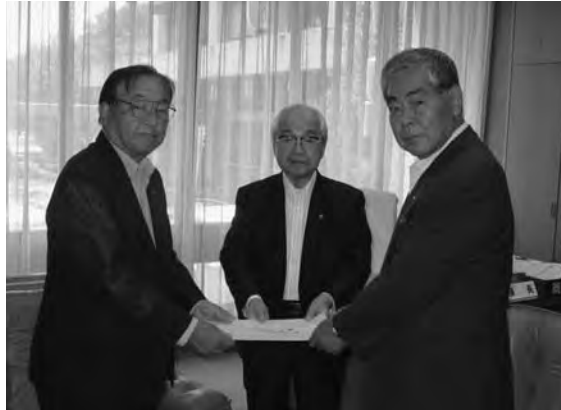
亀山市長（上）と幾井議長（下）への要望書の提出