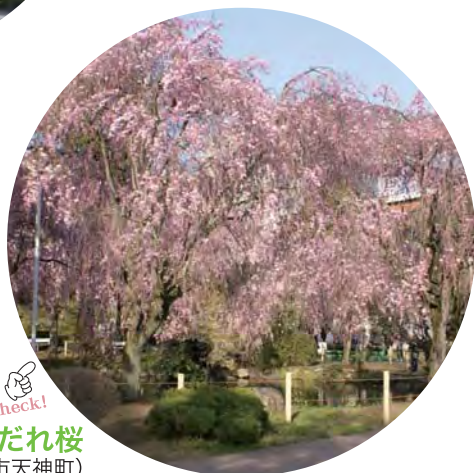
群馬大学工学部しだれ桜 (桐生市天神町)