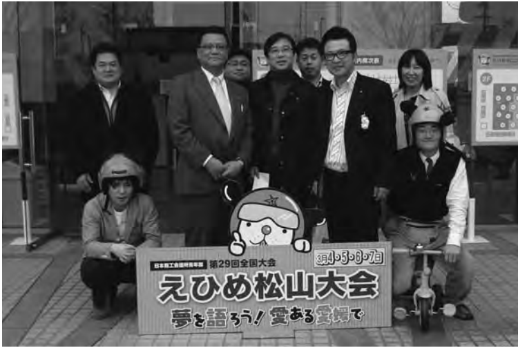
えひめ松山大会に参加した青年部メンバー

また、同大会への参加は当所青年部卒業生を慰労する卒業旅行も兼ねており、参加者は広島方面の旅行も楽し