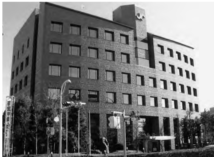
平成5年に多くの会員事業所の寄付により完成した商工会議所会館

中でも、昭和八年に境野村を、同十二年に広沢村を合併し、当時の人口は十万人に達し、さらに「工業戸数七千四百、商業戸数四千五百」というようにに市勢は大きく拡大していた。