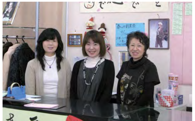
明るいスタッフがご来店をお待ちしています（ラピス桐生店）