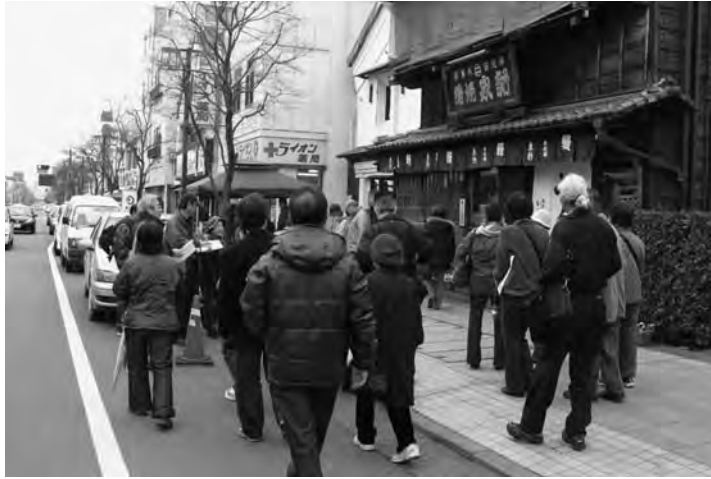
桐生の魅力を再発見したツアーとなった

「わがまち風景賞」とは、「新しい建造物と懐かしさを感じさせる年代物とが複合的に多様に共存するまち、そして生活者の息吹が感じられるまち。それが桐生市」であるという視点から、桐生の個性あるまち風景を形成している建造物や空間等のうち、特に良質な風景を創出しているものを毎年表彰している制度で、平成十三年にスタート、