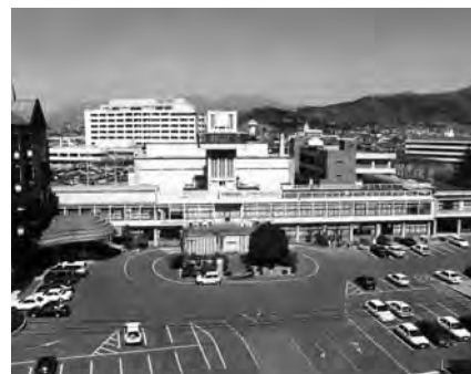
商工会議所事務局の変遷、左上から時計回りに桐生織物会館（戦前、戦後の一部）、桐生倶楽部（昭和21年～25年）、産業文化会館内（昭和33年～46年）、旧商工会議所会館（昭和46年～平成5年）