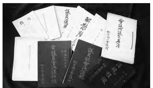
商工会議所創立時の資料

代会頭を引き継ぐが、昭和十八年十月に商工経済会法の施行に伴い群馬県商工経済会桐生支部へと組織変更され、三年間の会議所の歴史に幕を閉じる。本格的な桐生商工会議所の歩みが始まるのは、戦後になってからである。